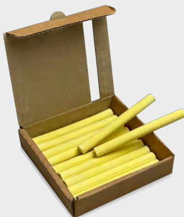
Colori Monocromatici - 18 pcs MHC 112