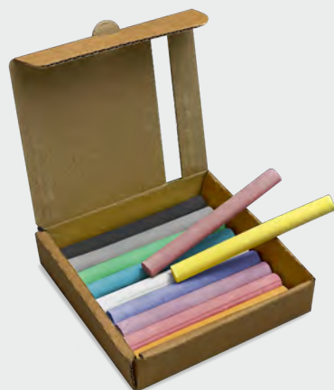
Colori Assortiti - 18pcs MHC 110