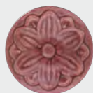
Raspberry Delight HSS 8-103 236 ml