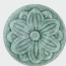
Mermaid's Tale HSS 8-116 236 ml