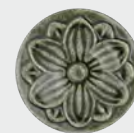
Lunar Eclipse HSS 8-118 236 ml