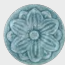
Sea Spray HSS 8-107 236 ml