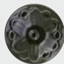
Galaxy Black HSS 8-109 236 ml