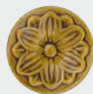
Amber Sparks HSS 8-105 236 ml