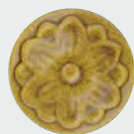
Midas Gold HSS 8-104 236 ml