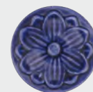
Blue Cosmos HSS 8-108 236 ml