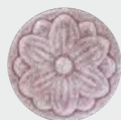
Pinky Toes HSS 8-101 236 ml