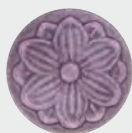
Fuchsia Razzle Dazzle HSS 8-102 236 ml