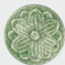
Sage HSS 8-117 236 ml