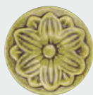
Naples Ochre HSS 8-111 236 ml