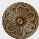
XO Brown HSS 8-110 236 ml