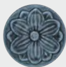
Moonglow HSS 8-115 236 ml