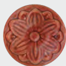
Venetian red HSS 8-113 236 ml