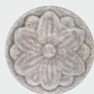
Grey Stardust HSS 8-100 236 ml