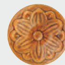
Sedona Sun HSS 8-112 236 ml