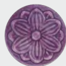
Amethyst HSS 8-114 236 ml