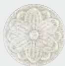
Dusty Clear HSS 8-005 236 ml