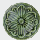
Emerald Forest HSS 8-106 236 ml